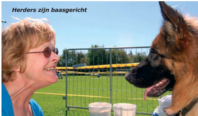
Herders zijn baasgericht

Op de kampioenschapsclubmatch in Leeuwarden waren honderden Duitse herderfans bij elkaar. Maar wat maakt de Duitse herder voor hen nu zo bijzonder, waarom kiezen ze juist voor dit ras? Een rondje langs enkele bezoekers wijst uit dat vooral de veelzijdigheid van de Duitse herder gewaardeerd wordt.