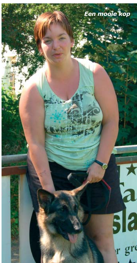
Een mooie kop

"Mijn vriend en ik hebben sinds 6,5 jaar Duitse herders. We wilden allebei graag een hond. Maar voor mijn vriend stond als een paal boven water dat hij géén kleine hond wilde. Uiteindelijk kwamen we uit bij de Duitse herder. De Duitse herdershond is trouw en je kunt er veilig mee over straat. Ook gaan ze voor je door het vuur. Wat uiterlijk betreft spreekt vooral de kop van de Duitse herder me aan. Persoonlijk houd ik overigens meer van teefjes dan van reuen: die zijn wat kleiner en handzamer.