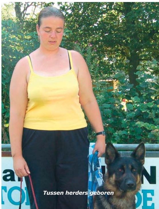
Tussen herders geboren