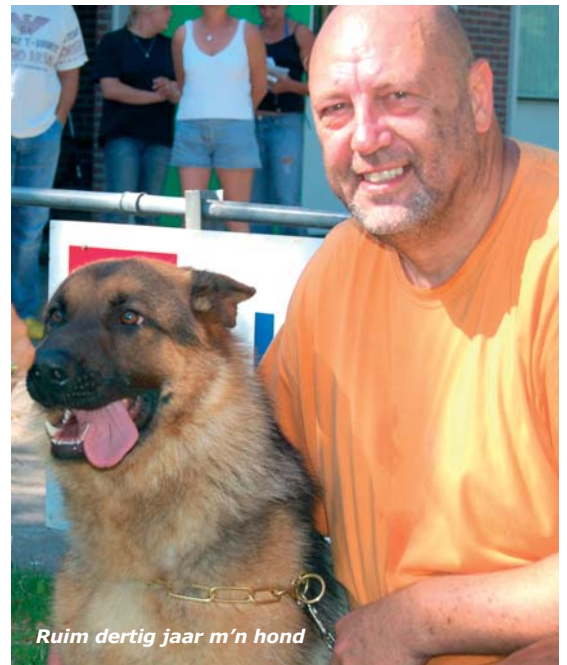
Ruim dertig jaar m'n hond

"Ik heb al ruim tien jaar Duitse herders. Het uiterlijk van dit ras spreekt me enorm aan. Waarschijnlijk omdat de Duitse herdershond veel weg heeft van een wolf, dat vind ik mooi. Daarnaast kun je met een Duitse herder alles doen op het gebied van hondensport. Zelf ben ik actief in de africhting en ik doe ook mee aan shows. Een ander pluspunt is dat Duitse herders stabiele honden zijn, ze zijn niet zenuwachtig of druk. Soms zie ik ook wel eens andere leuke honden lopen. Maar een andere ras kopen? Nee, daar pieker ik niet over."