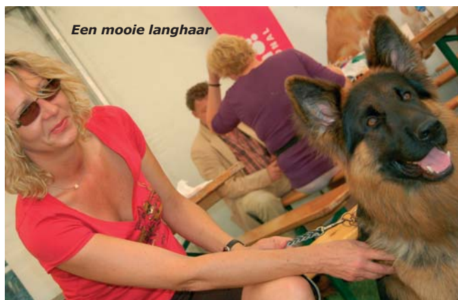
Een mooie langhaar